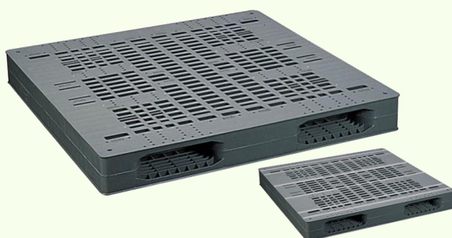
※ オプションで滑り止めテープの施工が出来ます。 溶着タイプ